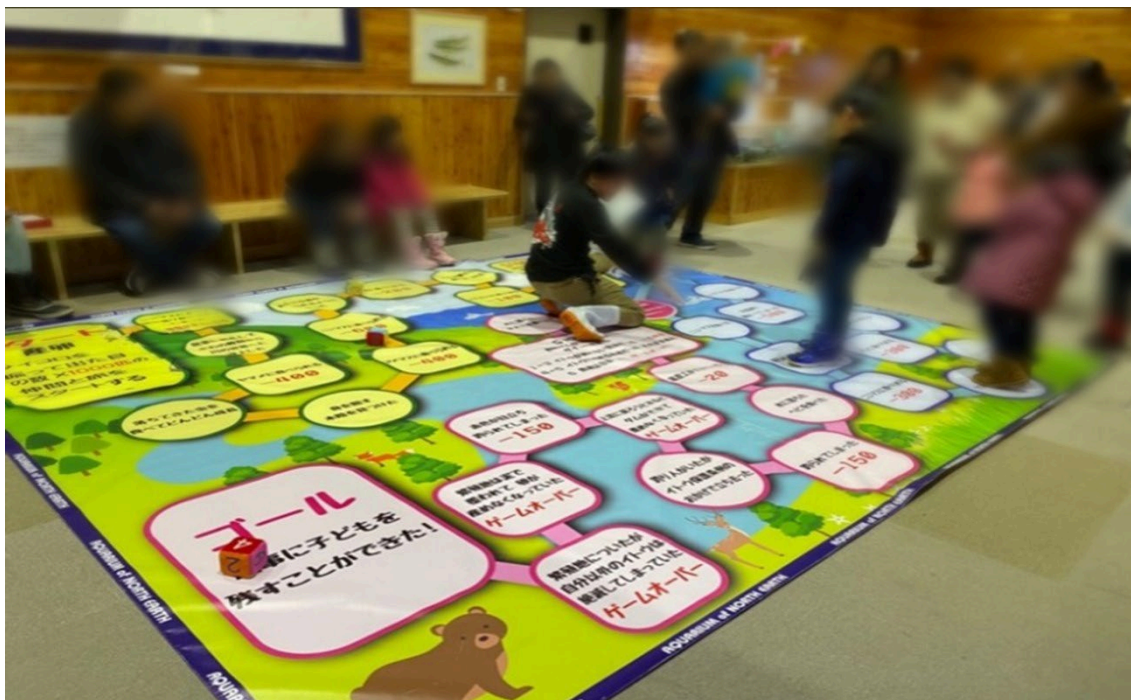
写真:イトウの一生すごろく(今回よりすごろくのマップのデザインも変わります。)

このすごろくマップを今回からリニューアルいたしました。難易度は下げず、マスの内容を最新の情報を盛り込んだものとなっています。