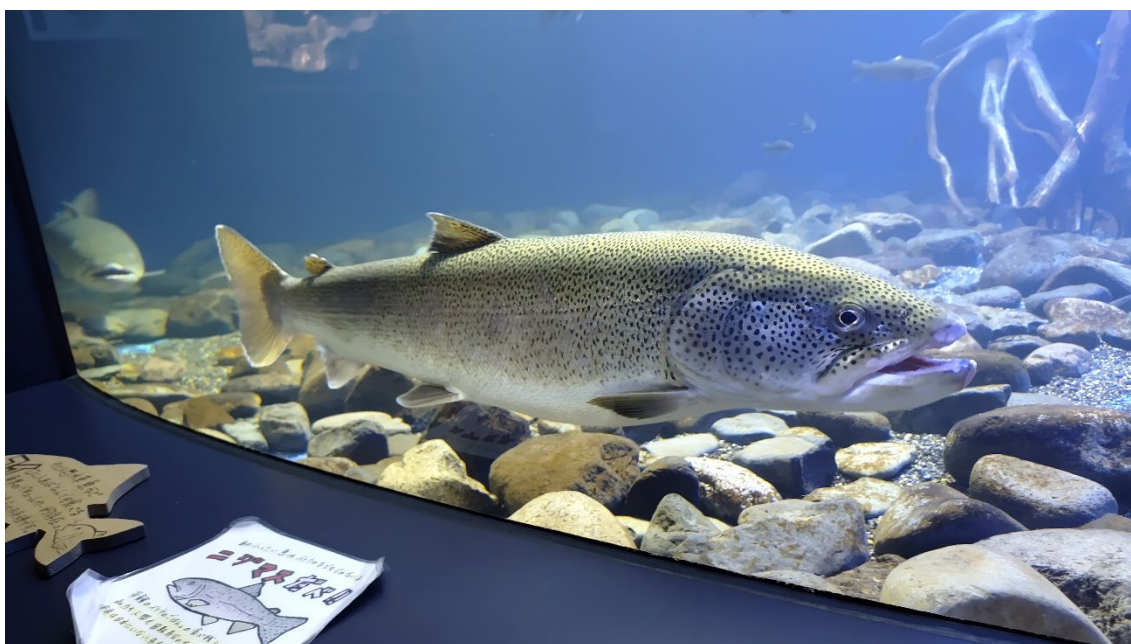
写真:メスのイトウ