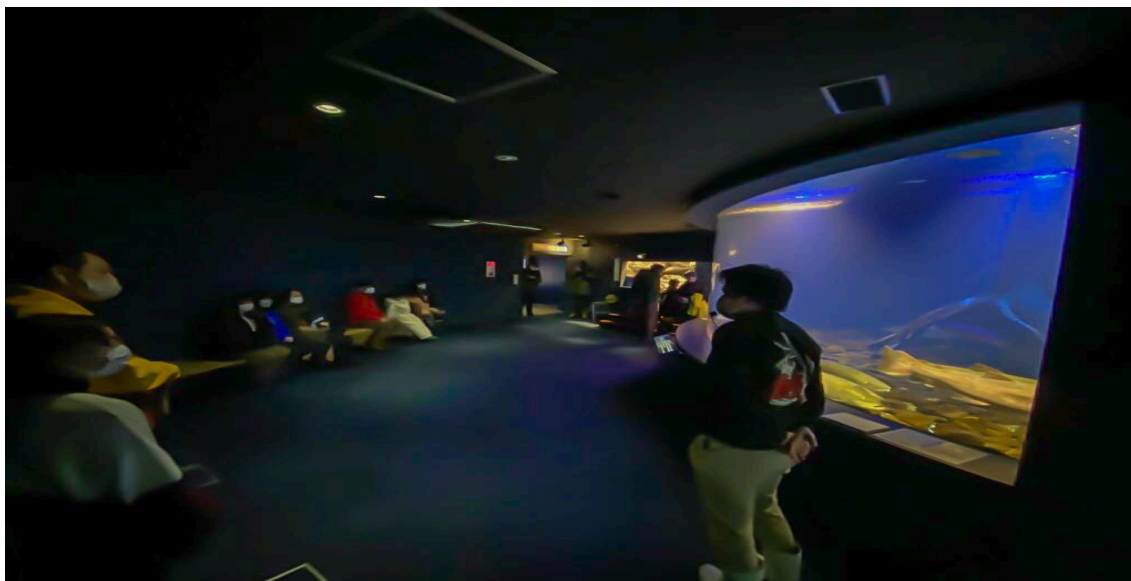
写真:イトーク！！の様子

1日4回（10:00～・11:30～・13:30～・15:30～）各回10～15分