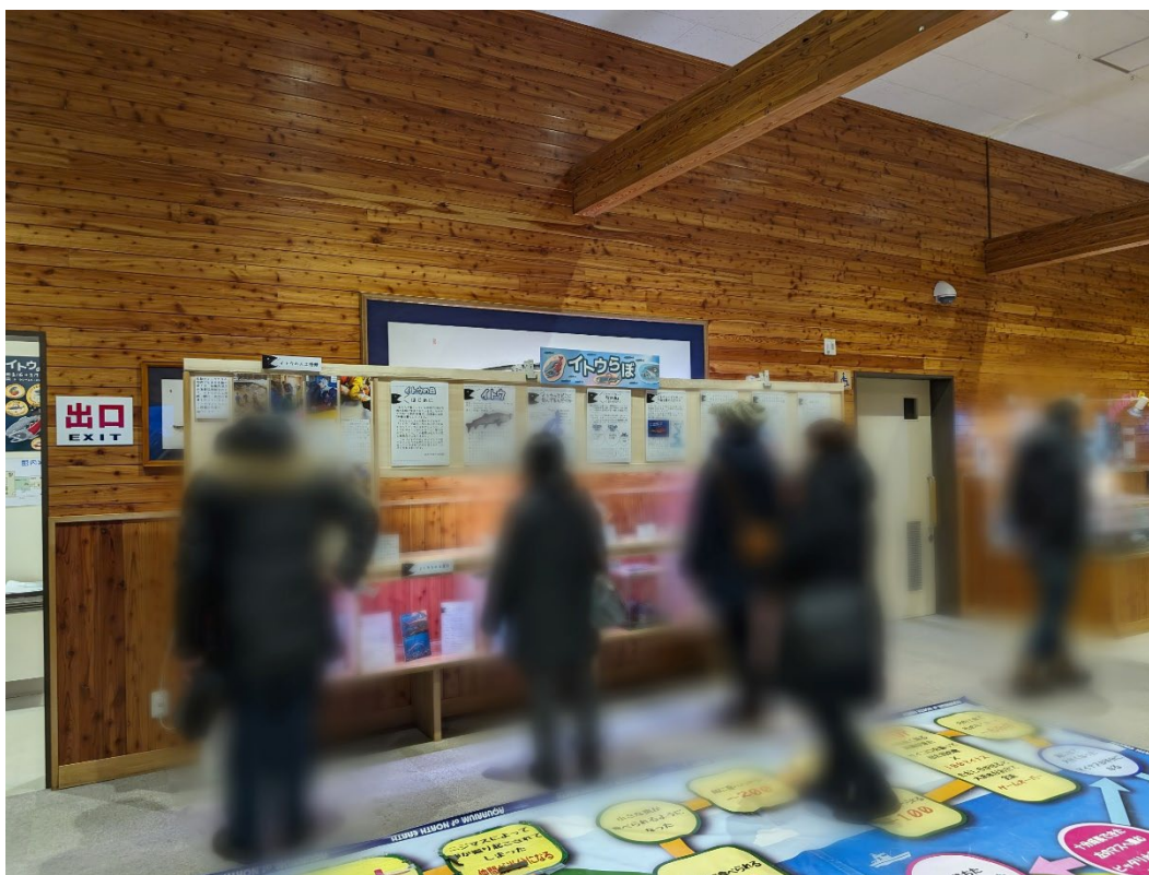
写真:イトウらぼ(過去の様子より)