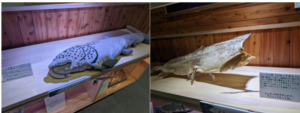
写真:イトウの重さを体感できるぬいぐるみ(左)とイトウの剥製(右)