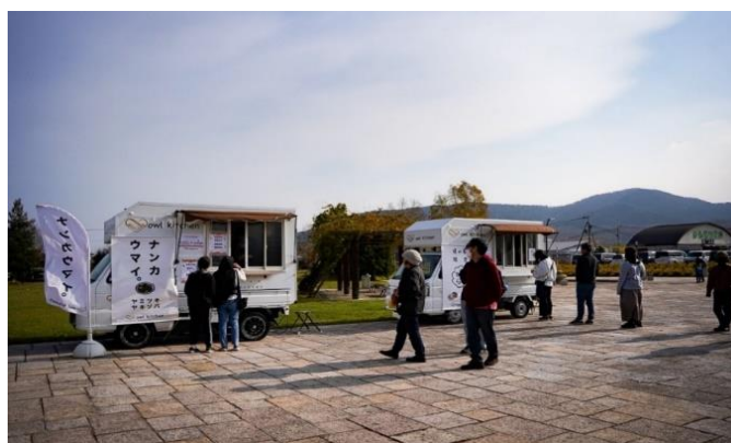
写真：2023年11月キッチンカームルシェ開催時の様子（現在出店舗調整中のため写真と異なる場合があります）