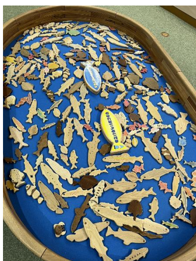
写真：果夢林ワールド釣り堀エリア