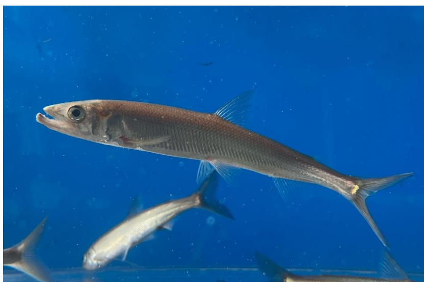
写真：キュウリウオ