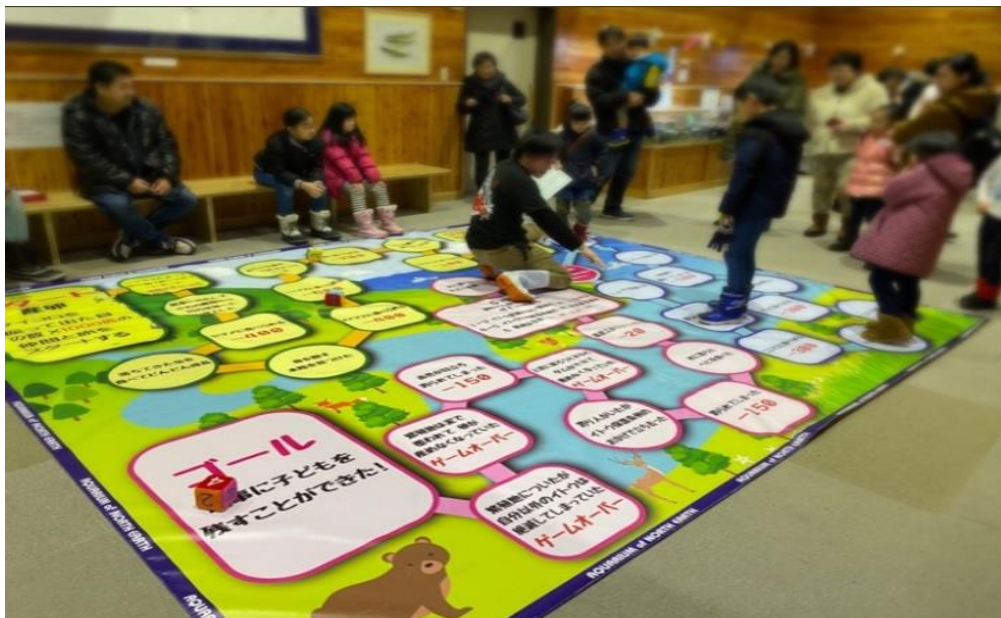
写真:イトウの一生すごろく

厳しいイトウの一生を体験できる巨大すごろくが登場します。スタッフ立ち会いのもと、一回でクリアできた方には限定デザインの缶バッチをご用意しています。