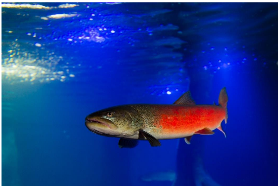
写真：繁殖期特有の婚姻色が現れたオスのイトウ