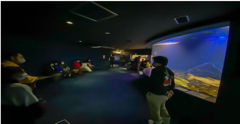
写真:昨年イトーーーク！の様子