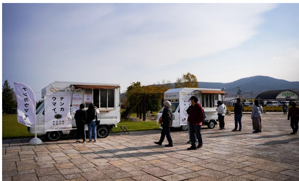
写真:11月キッチンカーマルシェ開催時の様子(現在出店舗調整中のため写真と異なる場合があります)

前回(11/3~11/5)開催時も道内各地から訪れる方が多く、今回も多くのお客様で賑わうことを期待しています。