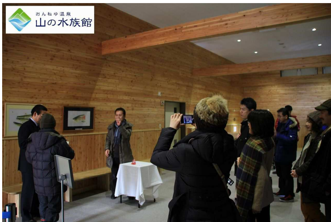
↑おんねゆ温泉・山の水族館で行われた抽選会の様子